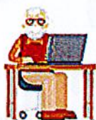
L'aide aux démarches administratives et à la constitution de dossiers d'aides financières