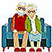
Le soutien à l'aidant