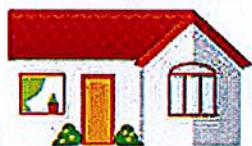
Les différents modes d'accueil et structures d'hébergement